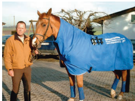
Körperdecke mit integriertem Halsteil und 25 Spulen

Außerdem verfügt das Steuergerät über einen Akku, der ca. 30 bis 40 Therapieeinheiten garantiert. Stromkabel sind während der Therapie nicht nötig.