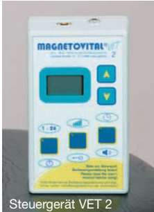
Steuergerät VET 2

Unser Steuergerät verfügt über 24 frei einstellbare Frequenzen und 9 unterschiedliche Intensitäten, die Sie in 10%-Schritten von 100% bis 20% verändern können.